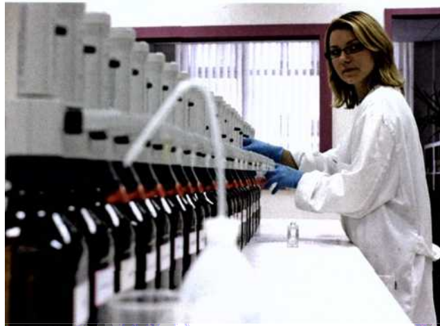
Online Parfum designen: Auch bei Onlinekreationen stellen geschulte Parfumeure passende Duftkombinationen zusammen und füllen diese in edle Flakons ab.

heit oder Jahreszeit den passenden Look – und dazu das Parfum. Damit für jede Jahreszeit das passende Wäscherchen bereit steht, sollte frau immer die passende Duftgarderobe griffbereit haben. Denn während im Frühling leichte Duftkomponenten wie Neroli, Maiglöckchen oder ein Hauch Jasmin dominieren, wird es im Sommer eher exotisch: Kokos, Pfirsich oder Orchidee geben in der heißen Jahreszeit den Duftton an. Und wenn der Herbst kommt, wird es wieder stürmischer, oft regnerisch und kühler. Die melancholische Zeit bringt auch viele schöne Gerüche mit sich. Warme und holzige Düfte wie Leder, Jasmin, Sandelholz, Vanille oder Rose werden zu einem sinnlichen Eau de Parfum kreiert. Diese Richtlinien für eine harmonische Parfumherstellung unterstützen Hobby-Parfümeure bei der richtigen Zusammenstellung, dennoch sollte frau dabei kreativ und mutig bleiben. Denn wie bei der Designerkleidung gilt es auch beim Parfum-Design, immer wieder ungewöhnliche Akzente zu setzen. ●