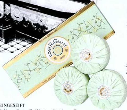
EINGESEIFT Seifencoffret »Thé Vert« mit grünem Tee von ROGER & GALLET, € 13,50.

PFLEGEN. Duschsals »Lavendel« von BIOEMSAN, € 42,90. Badeöl »Moroccan Rose Otto Bath Oil« von REN, € 39,-, bei niche-beauty.de . Badesalz »Fico d'India« von Ortigia, € 29,-, bei Nägele & Strubell.